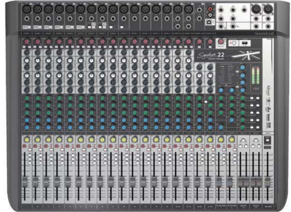
Signature 22 MULTI-TRACK