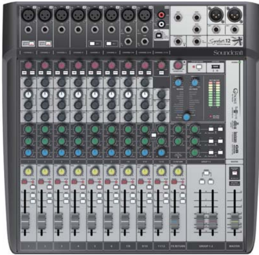
Signature 12 MTK

すべてのチャンネルの入出力が可能なUSBインターフェースを搭載したマルチトラックモデル。