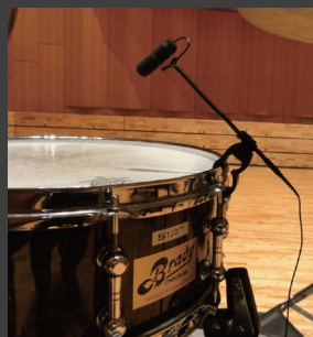
◀ DPA Microphones d:vote V04099のセット[V04-Rock]と[V010-Classic]を使用したマイクセッティング