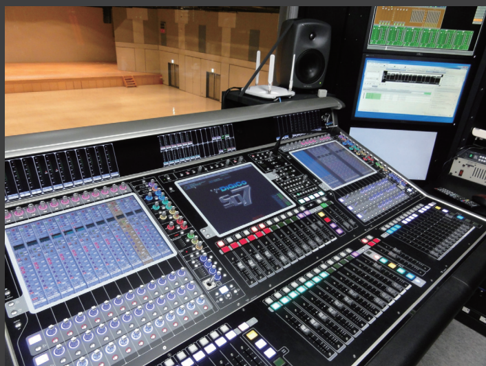
▲中ホール コントロールルームの DiGiCo「SD7」