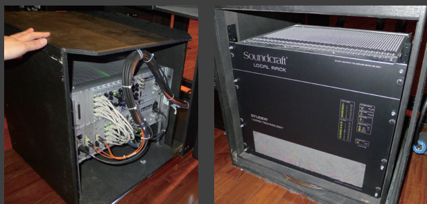
▲ Vi7000 のローカルラックは引き出して回転させることができ、メンテナンスが容易に行える。