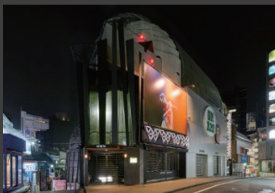
▲ WWW と WWW X が入るライズビルの外観。