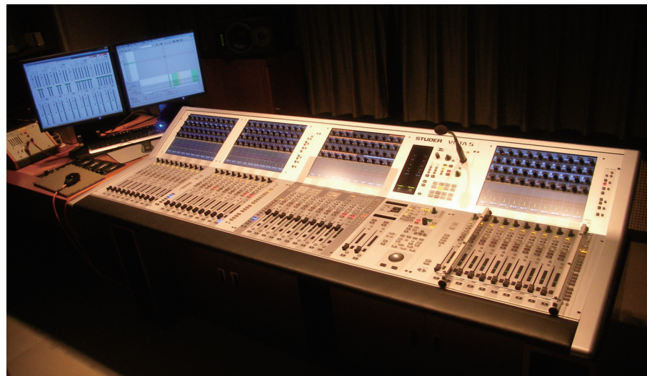
コントロールルームのSTUDER "Vista 5" 42 フェーダー

ネットワーク化された音響システムを一元管理。 多彩な公演のサウンドを自由な設定と優れた操作性でコントロール。