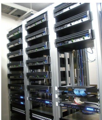
アンプルームの AMCRON "MA-5000i" と BSS Audio "BLU-160"

大ホールのプロセニアム、サイド、FB、シーリング、ステフロすべてのスピーカーに AMCRON のパワーアンプ "MA-5000i" と BSS Audio のシグナル・プロセッサー "BLU-160" が使用され、ソフトウェア London Architect でシステム構成を行っています。さらに、ソフトウェア System Architect でコントロールルームからパワーアンプを遠隔制御、モニタリングしており、音響システムの一元管理をしています。自由な設定と優れた操作性が受け入れられ、音質も良いとシステムの印象は上々です。