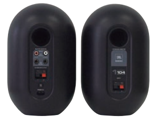
マスタースピーカー(左)と エクステンションスピーカー(右)の背面