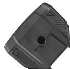
スタンドに設置したり、横向きに置いてステージモニターとしても使用可能。