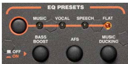
内蔵機能の操作部。ボタンのみで簡単に扱える。

■ 音楽/ボーカル/スピーチ/フラットから用途に合わせた音質を選択できる「EQプリセット機能」や低域を強調する「ベースブースト機能」、不快なハウリングを自動で抑える「ハウリングサプレッサー機能」、マイクに信号を入力するとBGMの音量を自動で下げる「ダッキング機能」を搭載しました。全ての機能はボタン一つで操作できるため、音響知識がなくても質の高いPAが簡単に行えます。出力を自動で制限しスピーカーの破損を防ぐ機能や信号の無入力状態が続いたときに自動で電源をOFFにする機能も搭載しました*。