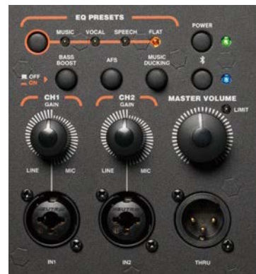
背面パネル。2chのミキサー機能 + Bluetooth入力を搭載。