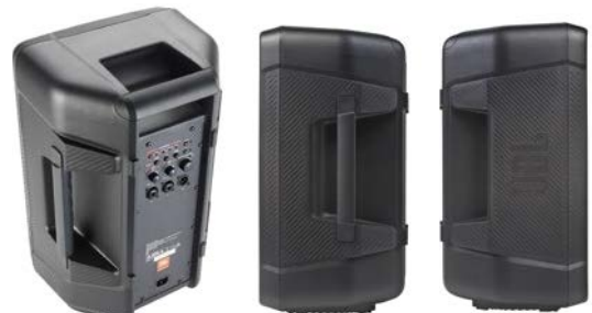
上面と両側面には人間工学に基づいて配置されたハンドルを装備。

■ スピーカーユニットは100時間のストレステストをクリアしており、過酷な環境でも安定して作動します。