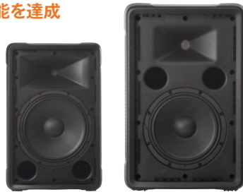
「JBL PROFESSIONAL」製の 高品位ドライバーを搭載 (左:IRX108BT-Y3、右:IRX112BT-Y3)

■ スピーカー開発で70年以上の歴史を持つ「JBL PROFESSIONAL」の技術を結集。数ランク上の上位機種と同等の音響品質を実現しており、スピーチやアナウンスはよりクリアに聞きやすく、音楽ソースは繊細かつ迫力のサウンドで再生できます。