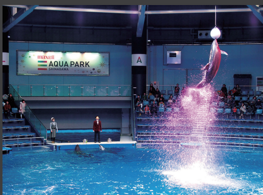
▲ 「ザ スタジアム」 でのドルフィン・パフォーマンス。