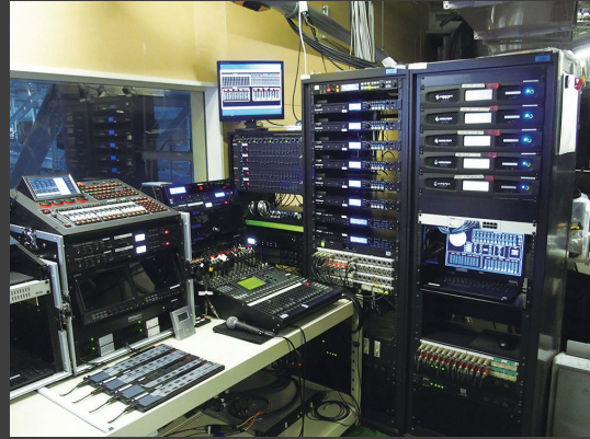
▲「ザ スタジアム」の調整室。モニタースピーカーには「AWC82」を使用。