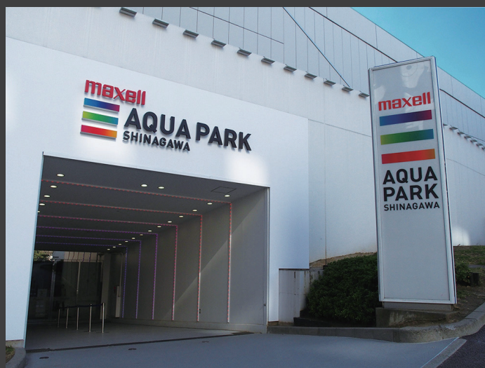
▲ 「マクセル アクアパーク品川」 エントランス。