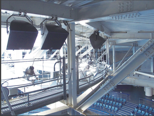
▲「ザ スタジアム」のプール上方中央から客席に向けて、「AWC159」が12本、「AWC15LF」が4本、円形状に設置されている。