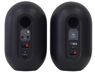
マスタースピーカー(左)とエクステンションスピーカー(右)の背面

■ ステレオミニフォン⇄RCAの接続ケーブルやマスタースピーカーとエクステンションスピーカーをつなぐスピーカーケーブルが付属しており、購入後すぐに使用できます。