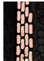
フラットワイヤー・ボイスコイル

K701-Y3は、見た目を裏切らない優れた音質を獲得しています。長年の研究開発で生み出された独自のオープンエア型構造を採用し、極めて優れた中高域の再現性を獲得。一つ一つの音を丁寧に描き出し、残響音さえも余すことなく再現します。また、リボン状のワイヤーを使用した「フラットワイヤー・ボイスコイル」を採用し、ボイスコイルの小型・軽量化に成功しました。優れた過渡特性を実現しており、微細な電気信号にも俊敏に反応。マグネットとボイスコイルのギャップを小さくできるため感度も向上します。さらに、ダイヤフラムには、2種類の素材を組み合わせた「TWO-LAYER ダイヤフラム」構造と中心部と外縁部で厚みを変える特許技術「バリモーション・テクノロジー」を採用しました。高域特性を維持しながら、ダンパー特性を改善し、分割振動を抑制します。